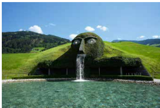
Bild: Swarovski Kristallwelten in Wattens

Die Reise führt uns diesmal in unser Nachbarland Österreich nach Mills bei Innsbruck. Übernachten werden wir in dem 4*-Hotel «Der Reschenhof» in Mills (mit grosszügigem Wellnessbereich). Geplant ist unter anderem ein Ausflug zu den «Swarovski Kristallwelten Wattens» und eine Besichtigung der Sprungschanze «Bergisel» mit Überblick auf ganz Innsbruck und eventuell anschliessend Kaffee und Kuchen im Bergisel-Restaurant. Wie jedesmal ist auch diesmal genügend freie Zeit eingeplant, um die idyllische und geschichtsträchtige Altstadt Innsbrucks mit seinem Dom, dem goldenen Dachstuhl oder dem Helbinghaus auf eigene Faust zu ergründen, die Tiroler Küche zu geniessen und/oder einfach shoppen zu gehen. Am Sonntag werden wir voraussichtlich an einem evangelischen Gottesdienst in der Christuskirche in Innsbruck teilnehmen – eine Besonderheit in einem Land, in dem die evangelische Kirche mit nur ca. 4% gegenüber 74% der vertretenen römisch-katholischen Kirche eine Minderheit darstellt.