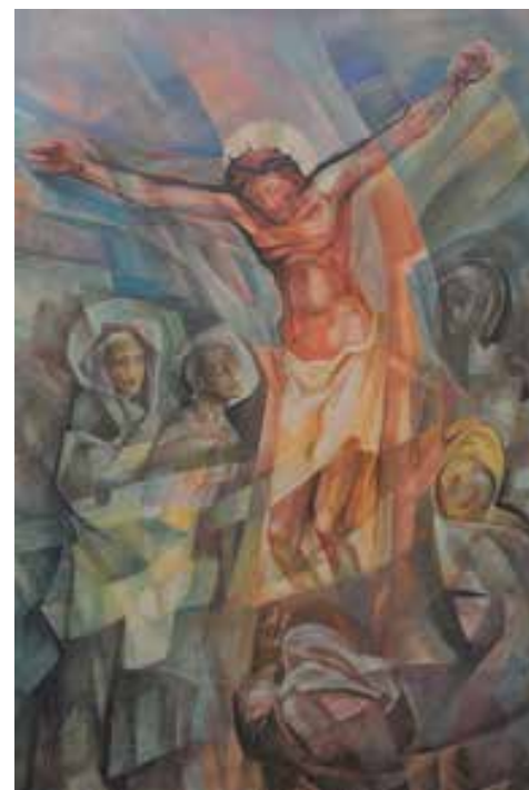
Bild (C. Mehl): Wandmalerei in der Chiesa di San Francesco d'Assisi in Faido

Liebe Maschwander und Maschwanderinnen, ich wünsche Euch eine besinnliche Passionszeit und frohe Ostern.